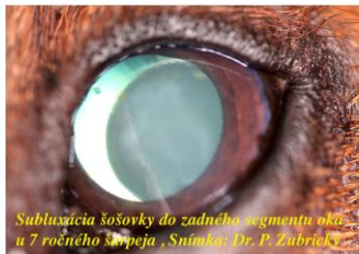
Subluxácia šošovky do zadného segmentu oka u 7 ročného šarpeja.