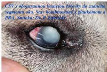
CSV s obojstrannou luxáciou šošovky do zadného segmentu oka. Stav kombinovaný s glaukómom a PRA.

Dedičnosť ochorenia sa predpokladá však u mnohých ďalších plemien, akými sú bretónsky španiel, šarpej, cairn teriér, manchesterský teriér, škótsky teriér, sky teriér, west highland white teriér a iné.