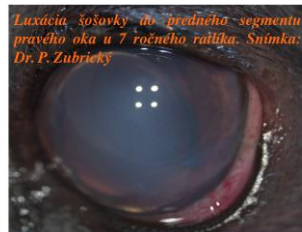
Luxácia šošovky do predného segmentu pravého oka u 7 ročného ratiľa.